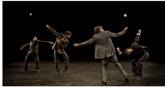
Collectif Petit travers